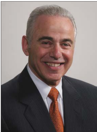
لایه نه کاند.

* له سه ر هاره واد بره کریت که هه موو لایه نه کانی عیراق کۆکن له سه ر نه وه ی که ده بی ت حکومه تی دا هاتو حکومه تیکی نیشتانی بی ت و رنگانه وه ی هه مه رنگی نه خسه سیاسییه که ی عیراق بی ت، ههروه ها ده بی ت پشت به نه جمای