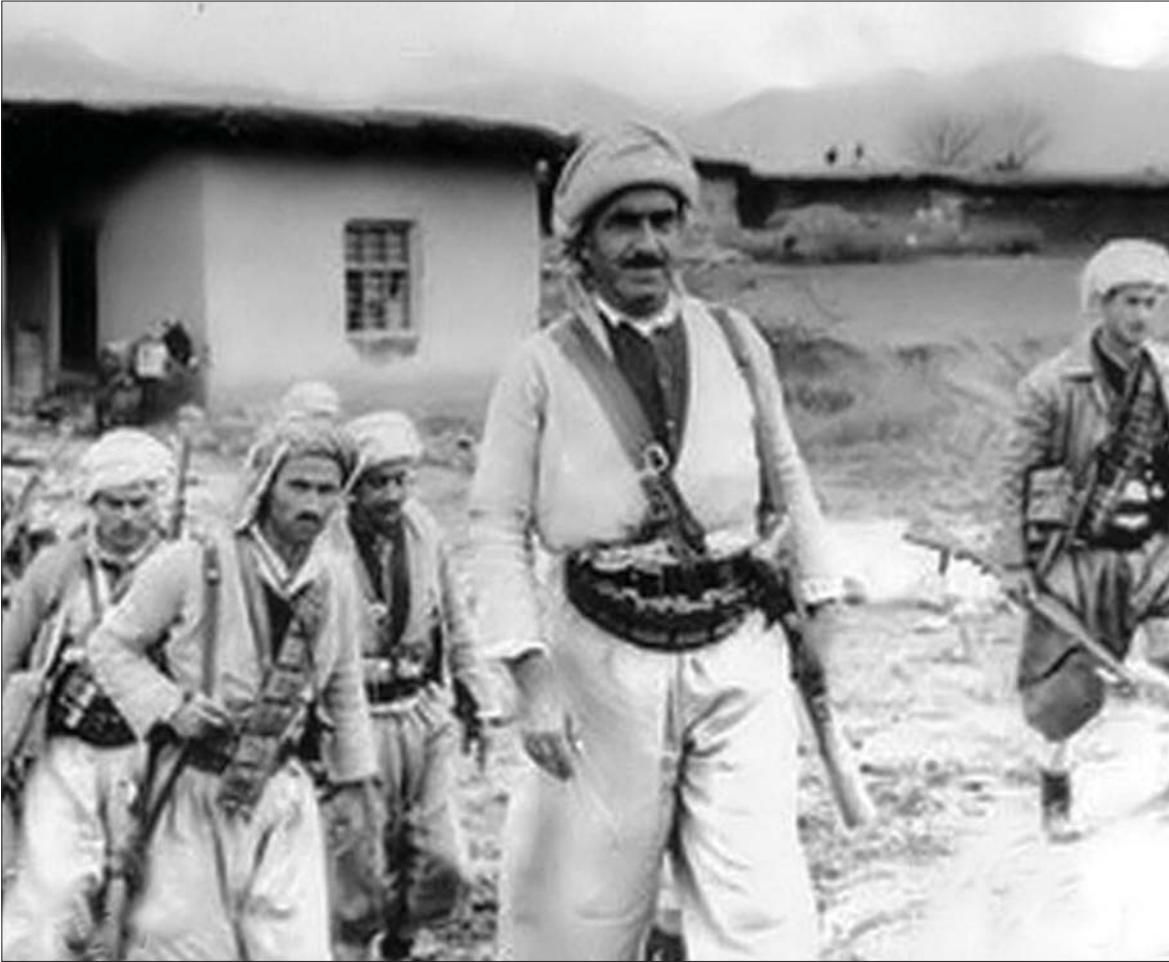
کاتیك هه مان پرسیار دووباره دهکهینه وه بارزانی باوک بۆ ئیمه مانای چیه؟ ده لئین مانای بونیدی سیاسی نهته وه پیناسه ی چه مکی نهته وه یه

کاتیك ئەم میژووێ تازیهی بارزانی باوک هه لدهسه نگیئینه وه، ده بینین وهر چه خانیك هه پیشتر ئەو میژووێ بهو چۆره نووسینه وه بوونی نه بووه، راسته توخمی سه ره کی نووسینه وه ی میژووێ کورد و کوردستان چه و سانه وه ئیراده ی راپه ربو بووه دژ بهو چه و سانه وه یه و نامانج بۆ لابر دنی ئەو چه و سانه وه یه و ئیراده ی راپه ربو بۆ ناشتی بووه، به لآم سه بر ده که ی بونیدی سیاسی هه یکه لی نه ته وه ناوچه گه ربی بووه، راسته ناماژه بۆ هه موو کورد وه که نه ته وه کراوه به لآم هه موو پیکهاته کانی نه ته وه ی کورد و گه لی کوردستان له شۆر شه کاندایه بشدار نه بوون، راسته ئیراده له نووسینه وه ی میژووێ کوردا توخمی سه ره کی بووه، به لآم ئیراده یه کی یه کگرتوو نه بووه، راسته نامانجی ناشتیش توخمی کی دیکه ی میژووێ ناشتیخوازانه ی کورد بووه، به لآم مه فهومی هینانه دی ناشتی مه فهومی کی سه رتاسه ری نه بووه، یان سه رتا پاگیه کوردستانی نه بووه، ئەم