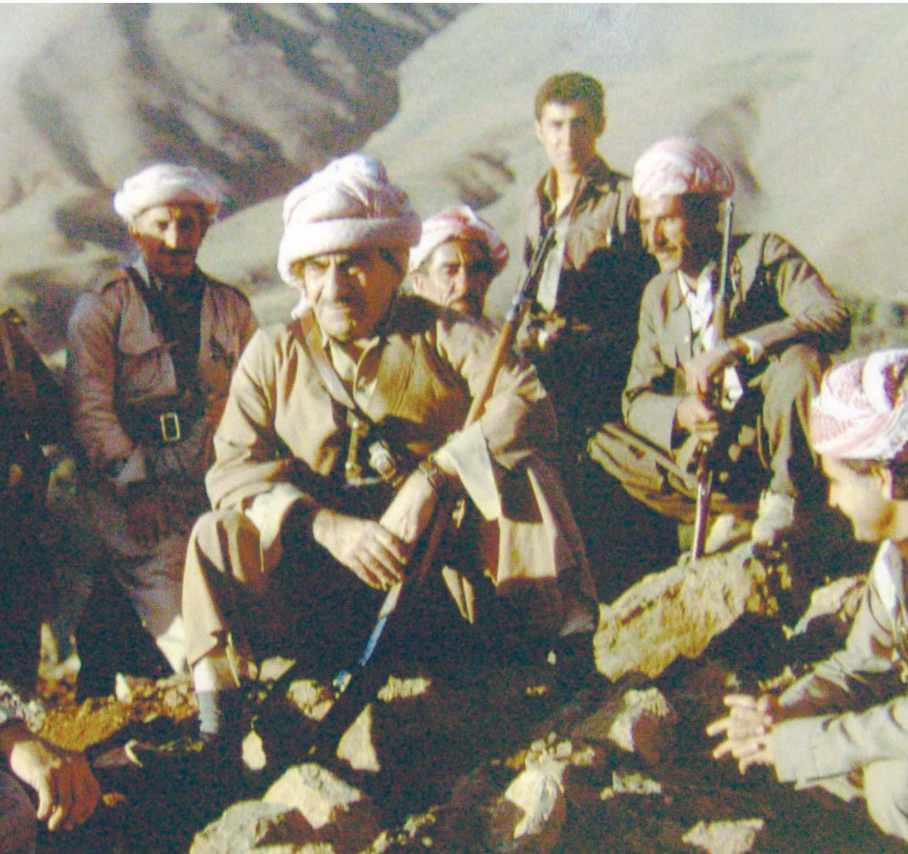
خیتابی بارزانی باوک وەلامی هەموو ئەو پرسیارانەى تێدا بوو کە پێشتر چەمکی نەتەوێى بى مانا کردبوو

بۆمان ماوێتەوێى، لەم پرسیار و وەلامە چى فێردەبین؟ بێگومان ئەوێمان فێردەکات کە هەمان پرسیار لەخۆمان بکەینەوێى، کاتیك یادى سەدو حەوتەمین سالیادی لە دایکبوونی بارزانی باوک دەکەینەوێى، لە جینگەى خۆیەتى لە خۆمان بپرسین ئایا بارزانی باوک بۆ ئیمە چى دەگەیهنیت؟ بێگومان لێرەدا جینگەى خۆیەتى بلیین وەلامى ئەم پرسیارە پێویستى بەو باکگراوندە مێژووییە هەبوو کە لە پێشەکی ئەم راپۆرتە نامازەمان پێکرد، ئەو باکگراوندە مێژووییە پێماندەلیت چۆن بارزانی نەمر لەو بارودۆخە سەختەدا بونیادی سیاسى نەتەوێى کورد و گەلى کوردستانی دارپشت و سەرلەنوێ